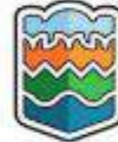
Університет Олександра Стулгінскіса (Литва)