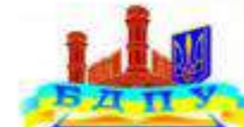
Бердянський державний педагогічний університет