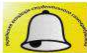
Українська асоціація самоврядування (з 2017 р. – Українська асоціація студентів)