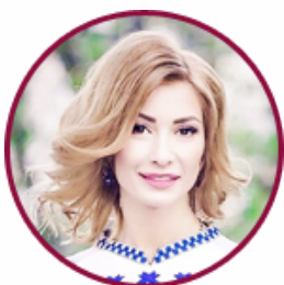
Анна Романова Народний депутат України, голова підкомітету з питань розвитку туризму, курортів та рекреаційної діяльності Верховної Ради України