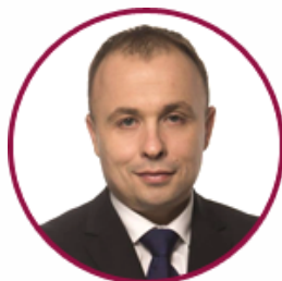
Роман Гребя Заступник Міністра освіти і науки України