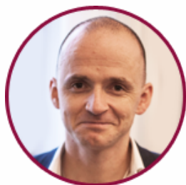
Олександр Лінчевський Заступник Міністра охорони здоров'я України