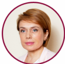
Лілія Гриневич Міністр освіти і науки України