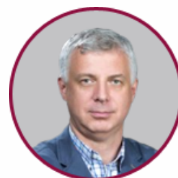
Сергій Квіт Голова Національного агентства із забезпечення якості вищої освіти