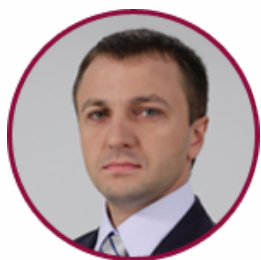
Тарас Кремень Народний депутат України, голова підкомітету з питань дошкільної, загальної середньої, інклюзивної освіти Комітету Верховної Ради України з питань науки і освіти