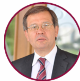
Тарас Фініков Президент Міжнародного фонду «Міжнародний фонд дослідження освітньої політики»