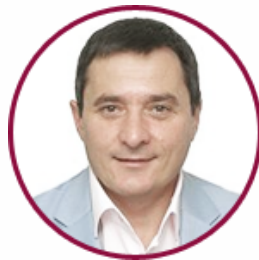
Руслан Гурак Голова Державної служби якості освіти України