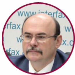
Андрій Шевцов Директор департаменту ліцензування Міністерства освіти і науки України