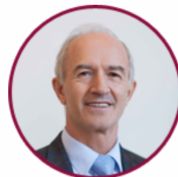
Юрій Рашкевич Заступник Міністра освіти і науки України