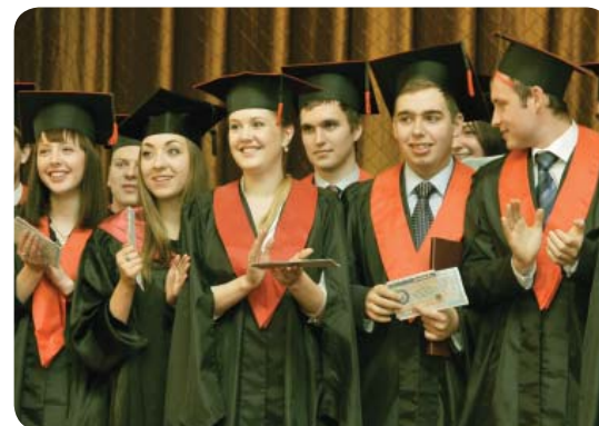
Мурга. В Україну їдуть абітурієнти з понад сотні країн світу, аби стати висококласними фахівцями

Першим освітянським осередком, побудованим на кшталт вищих навчальних закладів тогочасної Європи, стала Острозька школа із правами академії. Її відкрили у місті Острог 1576 року. Вона мала власну друкарню, величезну бібліотеку та першокласний викладацький склад. Перший повноцінний вищий навчальний заклад на теренах України з'явився у 1658 році. Це була Києво-Могилянська академія – перший університет не лише в Україні, а і у всій Східній Європі . Від самого заснування велику увагу тут приділяли вивченню мов, зокрема польській та латині. У Києво-Могилянській академії вчилася тогочасна політична еліта всієї Східної Європи. З її стін вийшли видатні українські гетьмани Іван Мазепа, Пилип Орлик та Іван Виговський. Саме тут отримали освіту український філософ Григорій Сковорода, фундатор першого російського університету в