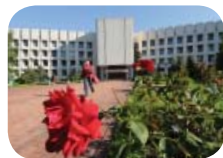
Ивашенко Ивашенко УИ 122439_200

Міжнародний відділ по роботі з іноземними студентами